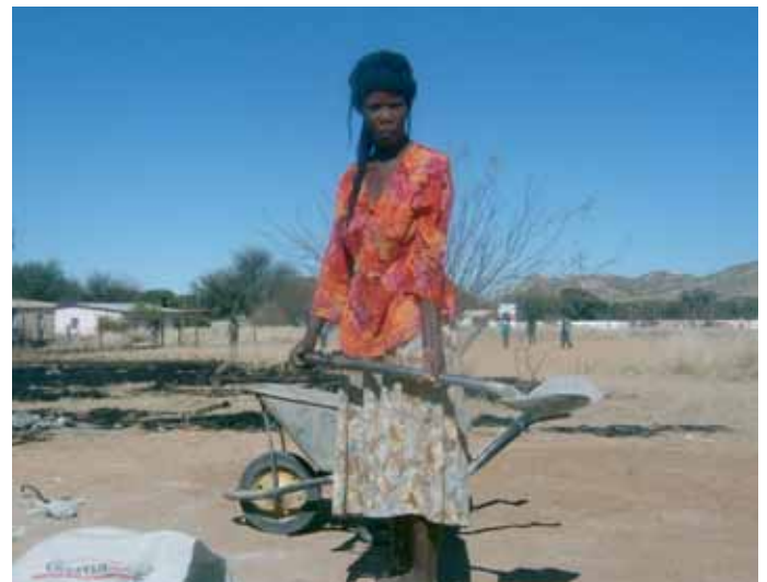
Hilfe soll nicht abhängig, sondern selbständig machen.