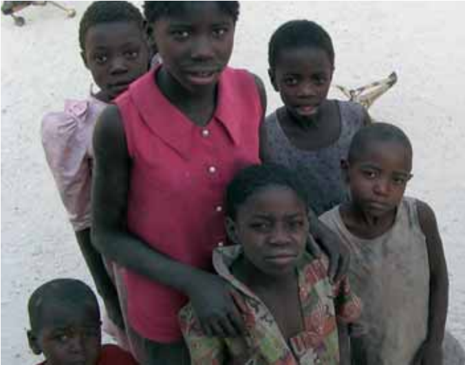
Viele Kinder leben in notdürftig selbstgezimmerter Hütten. Niemand kümmert sich um sie.

des stinkenden Abfalls nach Verwertbarem und Essbarem. Die Kinder gehen oft nicht zur Schule und sind krank. Es gibt weder fließendes Wasser, noch Kanalisation oder Strom. Niemand kümmert sich um sie. Die Kinder laufen zwischen pickenden Krähen auf der Müllkippe umher und suchen nach Essbarem. Gegen Mittag sind die Hitze und der Gestank unerträglich. Aus brennenden Müllhaufen steigt beißender Qualm in die Luft. Wenn sich der nächste Müllwagen nähert, stürzen sich alle auf den frisch abgeladenen Müll und versuchen, die „besten Stücke“ zu ergattern. Vor der Tür der improvisierten Suppenküche stehen erwartungsvoll diese Kinder, hauptsächlich Aids-Waisen. Sie werden mit einer warmen Mahlzeit versorgt. Unter Leitung einer erfahrenen deutschen Entwicklungshelferin kochen die einheimischen Frauen. Der Speiseplan bietet noch keine große Abwechslung, aber es wird daran gearbeitet, den meist unterernährten Kindern gehaltvolle und vitaminreiche Nahrung zu geben. Der Ankauf von Obst und Gemüse erfolgt bei einheimischen Bauern.