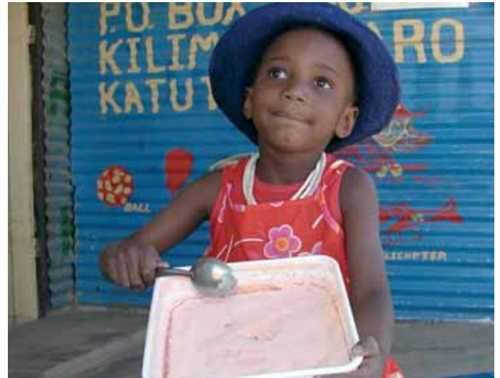
Hauptsächlich Aids-Waisen stehen vor der Tür der improvisierten Suppenküchen und werden mit einer warmen Mahlzeit versorgt.

Kinder aus armen Familien werden oft benachteiligt und ausgegrenzt. Neben dem Mangel an materiellen Dingen fehlt es oft an Zuwendung, Erziehung und Bildung. Kinder aus armen Familien haben häufiger gesundheitliche Probleme – verursacht durch falsche oder schlechte Ernährung. Jedes zehnte Kind lebt hierzulande in relativer Armut. 40 % der Kinder von Alleinerziehenden in Deutschland sind arm. Das heißt aber nicht, dass sie die einzigen Armen sind. Kinderreiche Familien, sehr junge Eltern und arbeitslose Eltern gehören ebenfalls dazu. Armut bedeutet für die Kinder vor allem Einschränkung, Verzicht und Ausgrenzung als fundamentale Erfahrung. Die möglichen Folgen sind geringes Selbstwertgefühl, Einsamkeit und Resignation. Diese Erfahrungen gefährden das Niveau ihrer Schulbildung und beruflichen Bildung. Die Beeinträchtigung der Entwicklung kann die eigene Identität dauerhaft schädigen. Die Häufung mehrerer Faktoren bzw. die Situation der Eltern, wie geringes Einkommen,