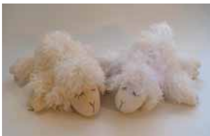
Vom Plüschtier „Schaf Martha“ wurden bereits mehr als 2.500 Exemplare verkauft. Der Erlös geht der Stiftung zu.